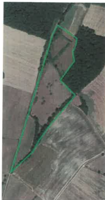
Plan de route hypothétique (en rouge) depuis la route départementale